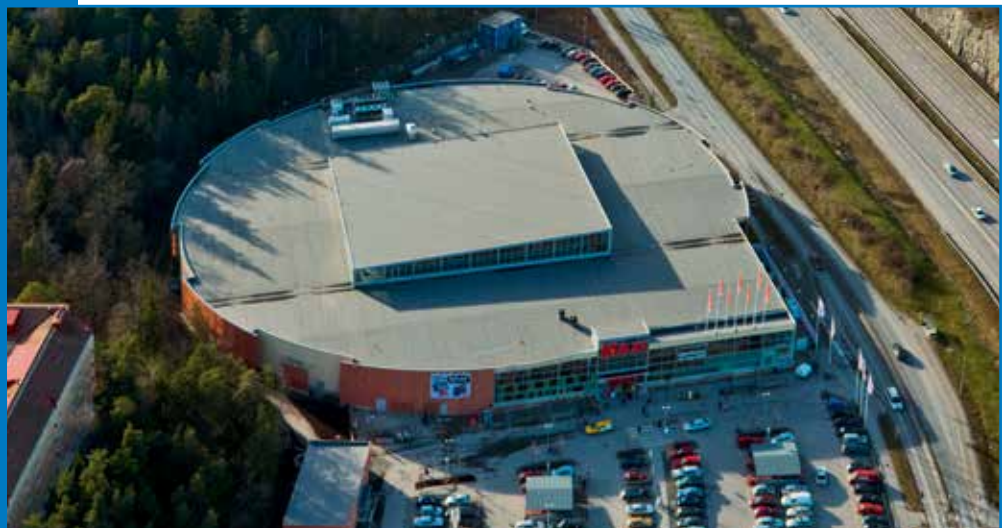
Ica Maxi, Stockholm